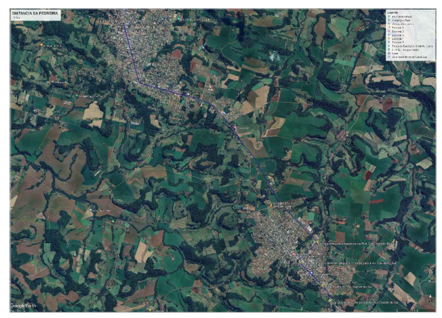
DISTÂNCIA FIXA DA PEDREIRA AO INÍCIO DO TRECHO 10,2Km